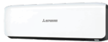
Black & White (-WB)